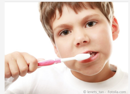
Bei der Prophylaxe lernen Ihre Kinder die richtige Zahnpflege.

Es gibt also keinen Grund, warum Sie auf Prophylaxe für Ihre Kinder verzichten sollten.